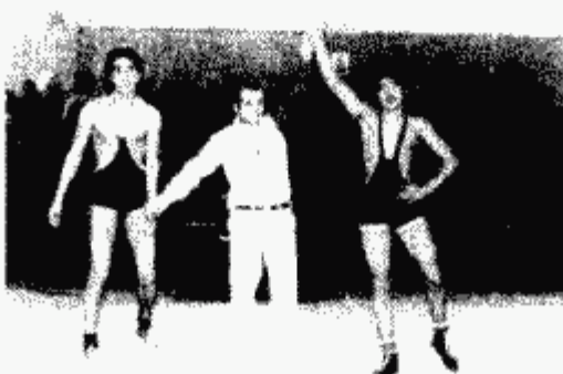
عکس های خانوادگی