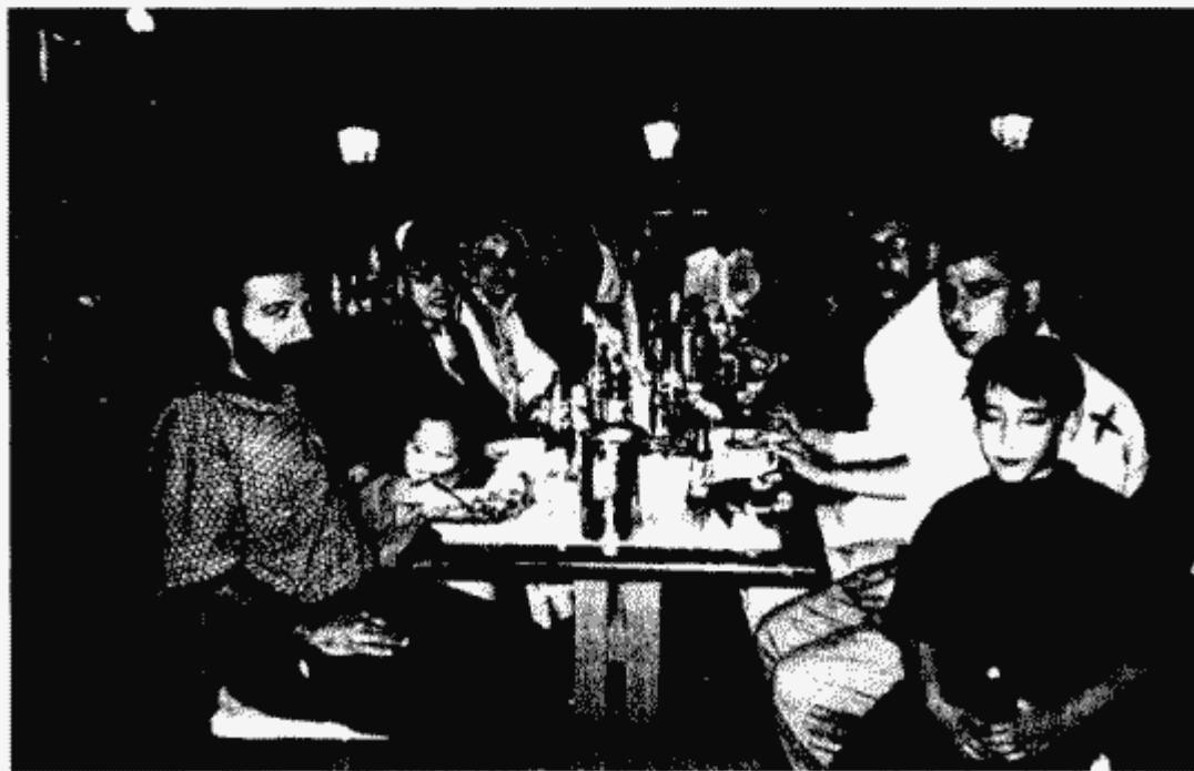
عکس های خانوادگی