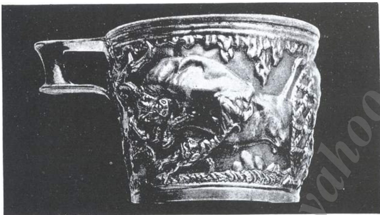
جام از آثار وافیو، موزه آتن،