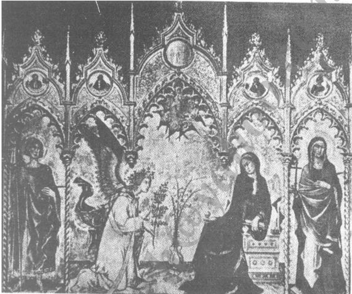
سیمونه مارتینی: عید بشارت؛ گالری اوفیتسی،

برمی‌خورند که درون آنها اجساد پادشاهان در حال فاسد شدن است. یکی از شکارچیان از شدت عفونت بینی خود را گرفته است؛ برفراز این صحنه، فرشته مرگ با داس عظیم خود بال‌گسترده است؛ در آسمان الاهگان رحمت ارواح رستگار را به فردوس برین همراهی می‌کنند؛ و در همان حال، دیوهای بالدار بیشتر مردگان را به دوزخ می‌کشانند؛ افعیها و لاشخورهای سیاه مشغول خوردن و تکه‌پاره کردن بدنهای عریان زنان و مردان هستند؛ و در زیر آنها، شاهان، ملکه‌ها، شاهزادگان، اسقفان، و کاردینالها در چاه ویل در هم ریخته‌اند. در فرسکو عظیم دیگری بر دیوار مقابل، همین نقاشان، در سمت چپ، صحنه واپسین داور و، در سمت راست، تصویر دیگری از دوزخ را نقش کرده‌اند. همه وحشتناک‌های الاهیات قرون وسطایی در این تابلو شکل جسمانی گرفته‌اند؛ دوزخ دانته است که بی‌هیچ‌گونه رحم و محدودیتی تجسم یافته است.